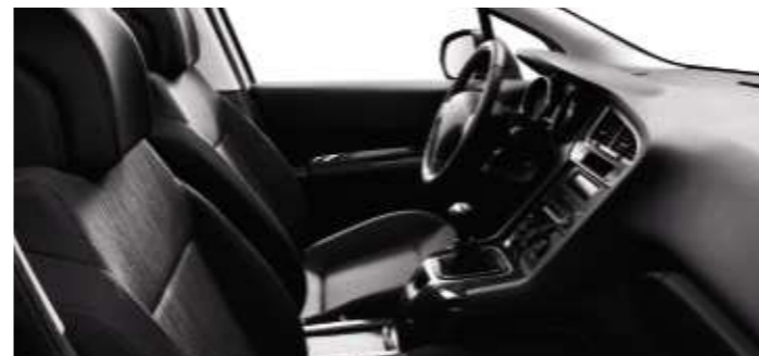
Tissu Ligne Noir Tramontane