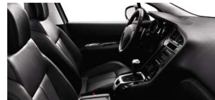
Cuir Noir Tramontane* (en option)