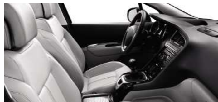
Cuir Guérande* (en option)